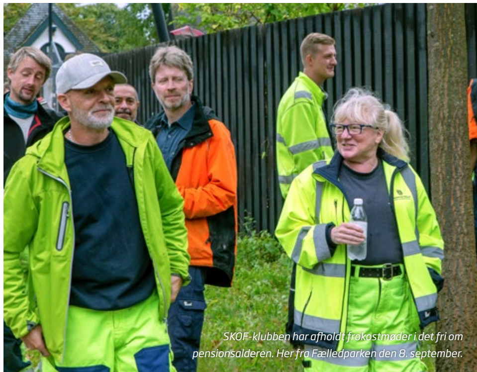
SKOF-klubben har afholdt frokostmøder i det fri om pensionsalderen. Her fra Fælledparken den 8. september.