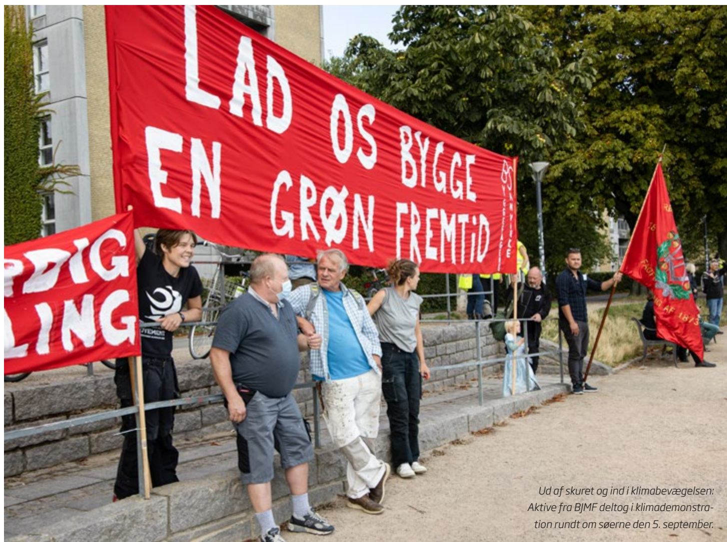
Ud af skuret og ind i klimabevægelsen: Aktive fra BJMF deltog i klimademonstration rundt om søerne den 5. september.

arbejdsløse bygningshåndværkere kan uddanne sig på dagpenge under ledighed og at den tid indregnes, fradrages i ledighedsperioden.