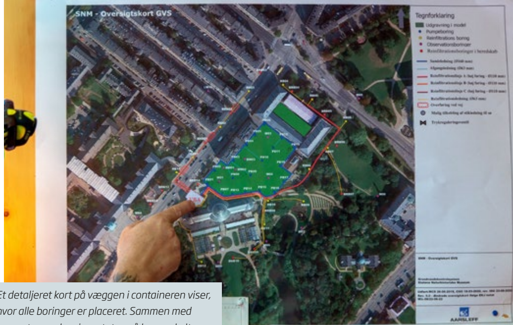
Et detaljeret kort på væggen i containeren viser, hvor alle borerne er placeret. Sammen med computeren, der viser status på hver enkelt pumpe, holder sjakket styr på grundvandet.

Læs om mere uddannelsen i Fagligt Fokus nr. 4 2020 - JBTI's brancheindstik, som findes på hjemmesiden: www.3f.dk/BJMF .