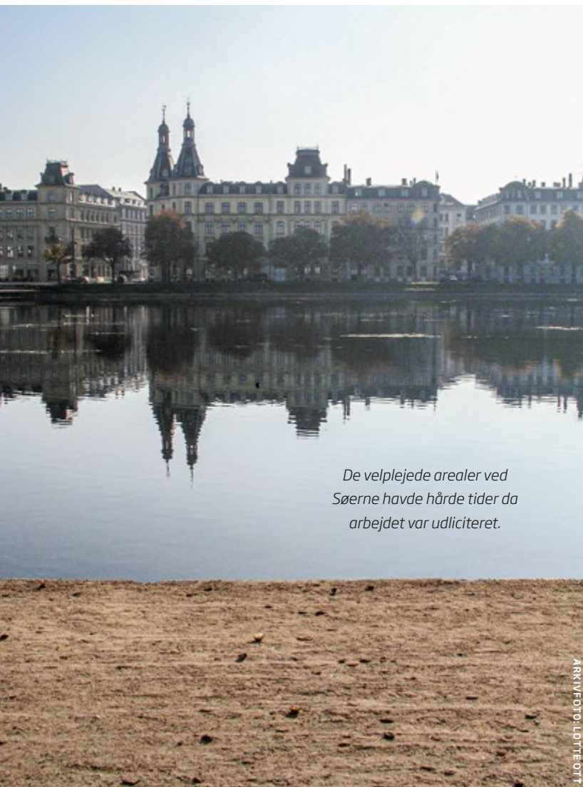
De velplejede arealer ved Søerne havde hårde tider da arbejdet var udliciteret.

3F tillidsfolk i TMF har opsamlet erfaringerne fra tidligere udliciteringer. I sidste nummer af Fagligt Fokus fortalte de om brøndene i vejen, der forstoppede og Amager Strandpark, der sandede til. Denne gang er turen kommet til Søerne i København. ■